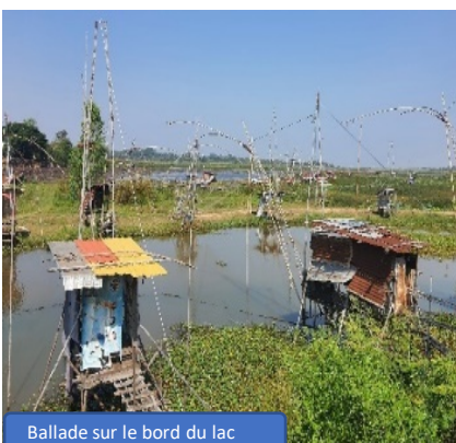
Ballade sur le bord du lac

Visite de la planète des singes Gratuit, proximité du restaurant