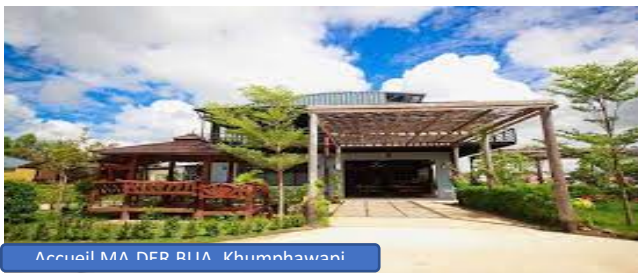
Accueil MA DER BUA Khumphawapi

cout du programme, 650 BATH par participant a régler avant le 31/12 lors de votre réservation Pensez a préciser le ou les programmes choisi est