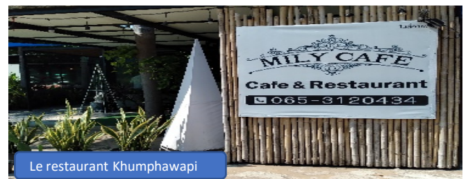
Le restaurant Khumphawapi

Claude, Dominique RIGAL Banque AYADHUYA KMA . compte No 800-9-08711-7